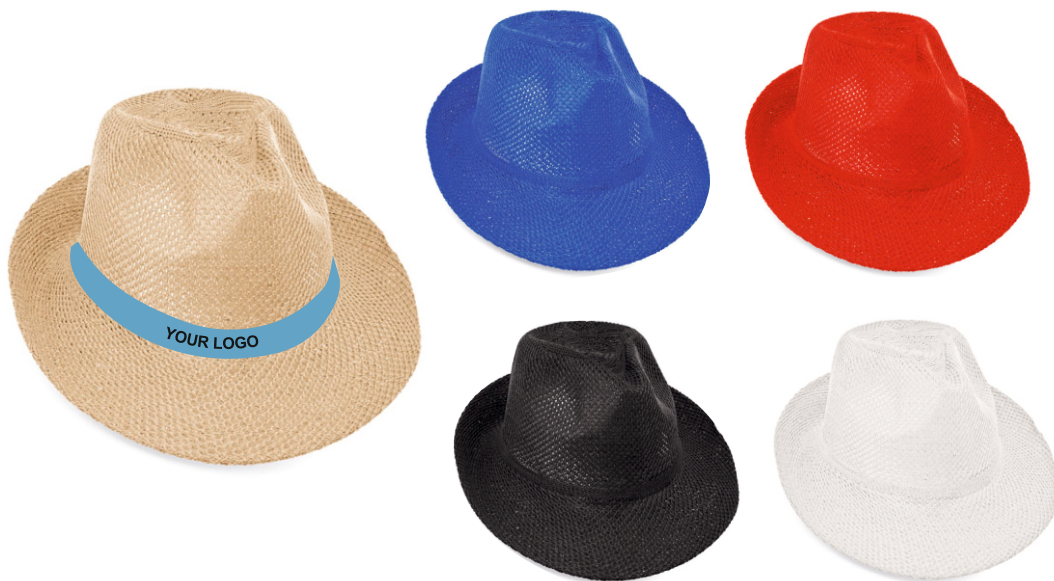
2393 Καπέλο ψάθινο Τύπωμα: 1)κορδελα non wooven 2)κορδελα polyester,3)κορδέλα cotton, 4)κορδελα φαιλού Διάσταση κορδέλας:45x2 εκ