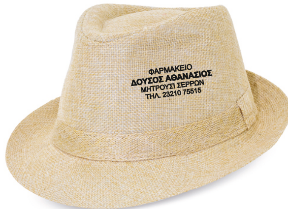
7524 Καπέλο καβουρακι "BODA" Τύπωμα: μεταξοτυπία