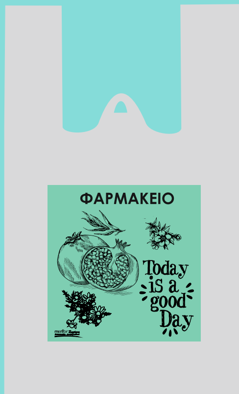
11106 Σακούλα πλαστική περφορέ Διάσταση: 30*55 εκ. Πάχος: 22 micron Ποσότητα: 1000 τμχ