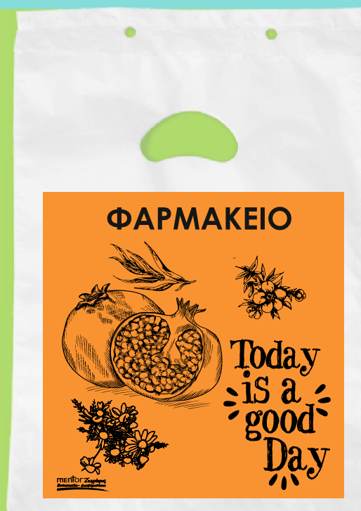
11103 Σακούλα πλαστική περφορέ Διάσταση: 25*35 εκ. Πάχος: 22 micron Ποσότητα: 3000 τμχ