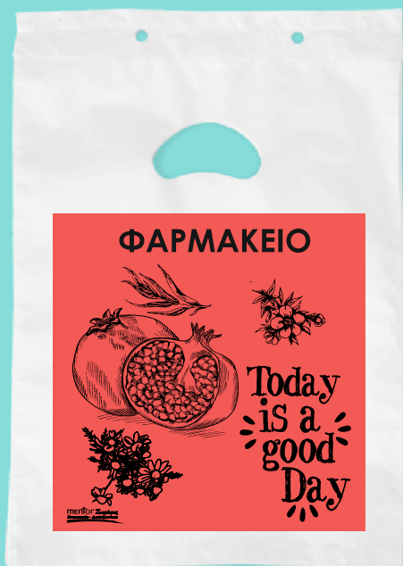
11100 Σακούλα πλαστική περφορέ Διάσταση: 17*25 εκ. Πάχος: 22 micron Ποσότητα: 5000 τμχ