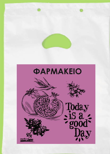
11102 Σακούλα πλαστική περφορέ Διάσταση: 20*30 εκ. Πάχος: 22 micron Ποσότητα: 5000 τμχ