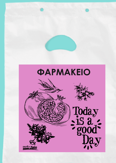
11101 Σακούλα πλαστική περφορέ Διάσταση: 17+3*27 εκ. Πάχος: 22 micron Ποσότητα: 4000 τμχ