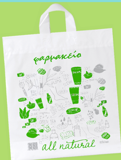
1204 Σακούλα λούπ Διάσταση: 40*40+πιετα εκ. Παχος: 22 micron Ποσοτητα:400τμχ