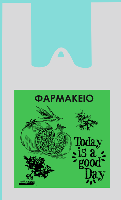
11105 Σακούλα πλαστική περφορέ Διάσταση: 25*45 εκ. Πάχος: 22 micron Ποσότητα: 2000 τμχ