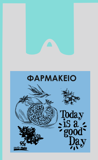
11104 Σακούλα πλαστική περφορέ Διάσταση: 22,5*35 εκ. Πάχος: 22 micron Ποσότητα: 2500 τμχ